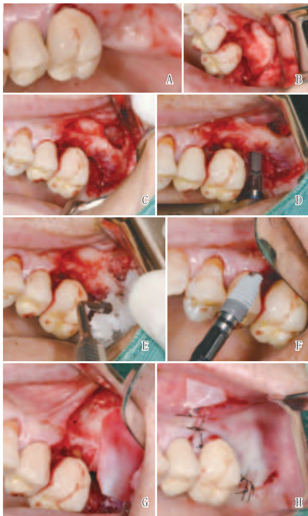
注：A. 术前口内照；B. 切开翻瓣；C. 开窗行窦底提升；D. 制备种植窝洞；E. 植入Bio-Oss骨粉；F. 植入种植体；G. 植入海奥口腔修复膜；H. 缝合后即刻口内照